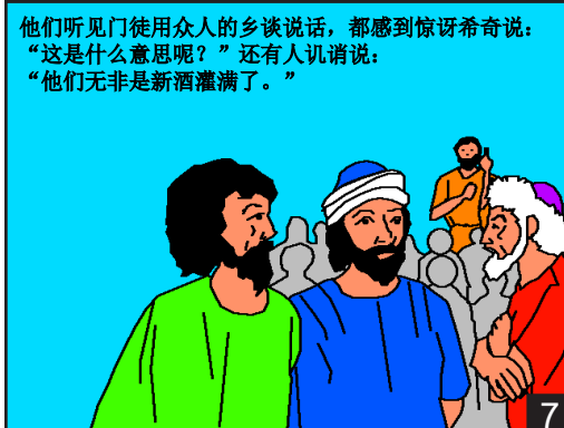
他们听见门徒用众人的乡谈说话，都感到惊讶希奇说：“这是什么意思呢？”还有人讥消说：“他们无非是新酒灌满了。”