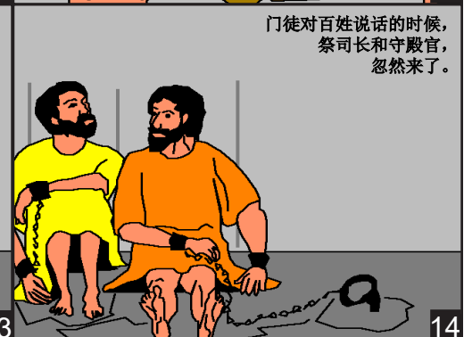
门徒对百姓说话的时候，祭司长和守殿官，忽然来了。