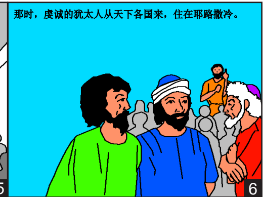
那时，虔诚的犹太人从天下各国来，住在耶路撒冷。