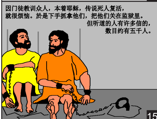
因门徒教训众人，本着耶稣，传说死人复活，就很烦恼。於是下手抓拿他们，把他们关在监狱里。但听道的人有许多信的，数目约有五千人。