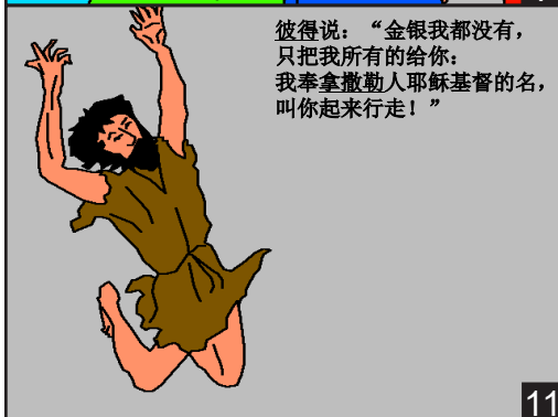
彼得说：“金银我都没有，只把我所有的给你：我奉拿撒勒人耶稣基督的名，叫你起来行走！”