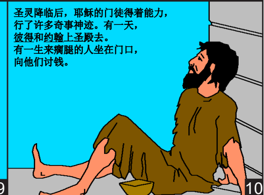
圣灵降临后，耶稣的门徒得着能力，行了许多奇事神迹。有一天，彼得和约翰上圣殿去。有一生来瘸腿的人坐在门口，向他们讨钱。