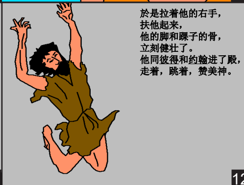
於是拉着他的右手，扶他起来，他的脚和踝子的骨，立刻健壮了。他同彼得和约翰进了殿，走着，跳着，赞美神。