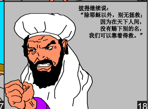
彼得继续说：“除耶稣以外，别无拯救；因为在天下人间，没有赐下别的名，我们可以靠着得救。”