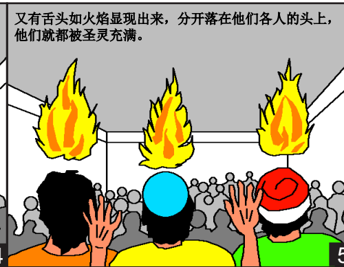
又有舌头如火焰显现出来，分开落在他们各人的头上，他们就都被圣灵充满。