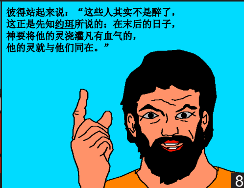
彼得站起来说：“这些人其实不是醉了，这正是先知约珥所说的：在末后的日子，神要将他的灵浇灌凡有血气的，他的灵就与他们同在。”