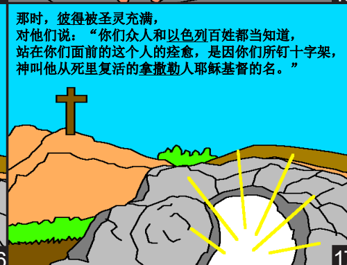
那时，彼得被圣灵充满，对他们说：“你们众人和以色列百姓都当知道，站在你们面前的这个人的痊愈，是因你们所钉十字架，神叫他从死里复活的拿撒勒人耶稣基督的名。”